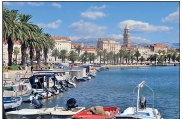
Die Hafenspromeade von Split