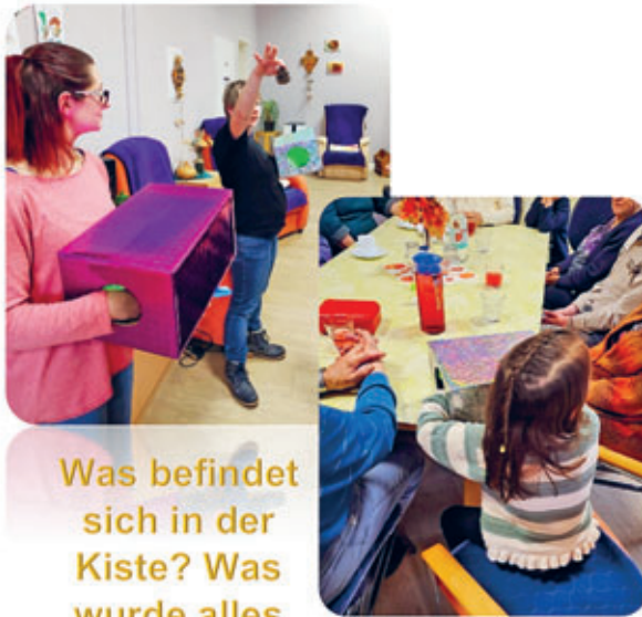
Was befindet sich in der Kiste? Was wurde alles erföhlt?

Im Juni 2023 kam die Tagespflege Milnikel & Schymik auf uns zu und fragte an, ob wir Interesse an einer Zusammenarbeit hätten. Seither wächst diese Kooperation heran. Regelmäßige Besuche unserer Kinder, bei den Senioren der Tagespflege, integrieren wir in den Kitaalltag. Von diesem generationsübergreifenden Projekt profitieren Jung und Alt. Durch die professionell gestaltete Begegnung, bei der gemeinsam musiziert, gebastelt, Brettspiele gespielt oder gepuzzelt wird, fördern wir die Kommunikation und das Verständnis füreinander. Dieses Aufeinandertreffen bringt Freude und Herzlichkeit und prägt die gegenseitige Wertschätzung.