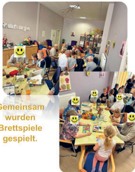
Gemeinsam wurden Brettspiele gespielt.