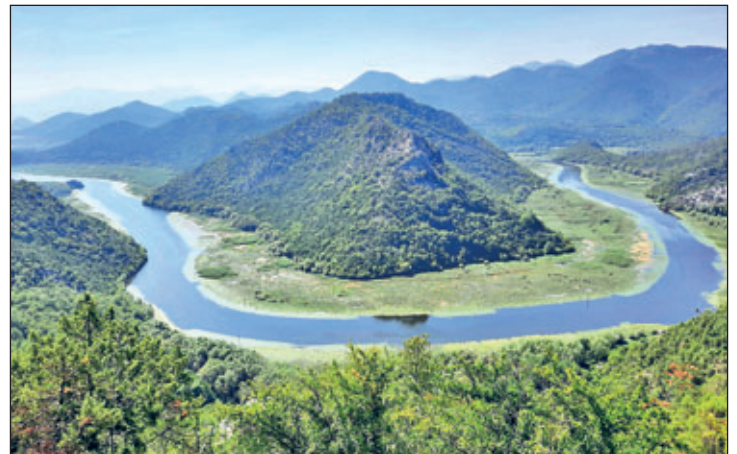
Fluss-Schleife des Flusses Crnojević kurz vorm Skadarsee

Fotovortrag über eine selbst organisierte Reise nach Montenegro. Dabei werden auf der Hinfahrt die Orte Jajce und Mostar in Bosnien-Herzegowina besucht. Im kleinen Staat Montenegro sind die wundervolle Natur des Dumitor-Gebirges, das Mausoleum im Lovcen-Nationalpark auf einem Gipfel, das Schinkendorf Njegusi und natürlich die Orte an der Adria im Besuchsprogramm enthalten. Die Rückreise wird über die kroatischen Weltkulturerbe-Städte Dubrovnik und Split führen.