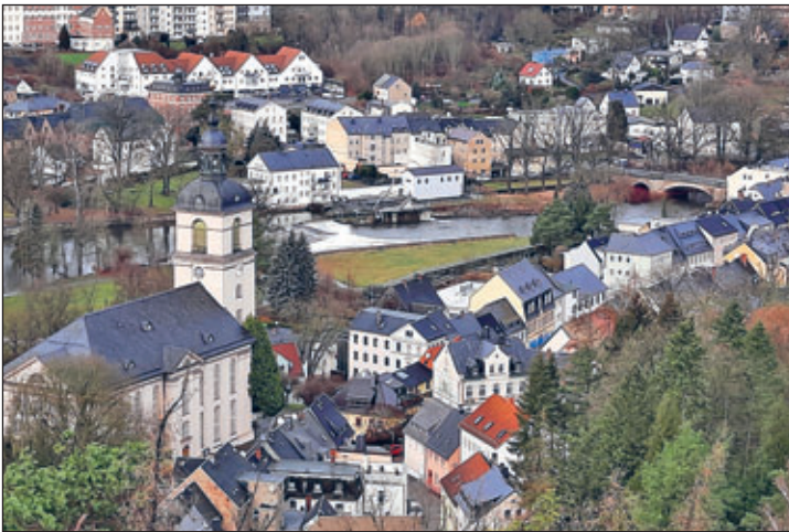
Blick vom Wachbergturm auf Waldheim nach dem Regen

Der Waldheimer Verschönerungsverein freut sich, dass dieses Ereignis trotz vorausgegangenem schlechten Wetters so angenommen wurde. Er sagt allen Besuchern Danke. Denn damit lohnte sich die Mühe einiger Mitglieder, die z. B. die Wege zum Turm von Sturmschäden befreiten oder die die Vorbereitungen zu dieser besonderen Öffnung des Wachbergturmes durchführten.