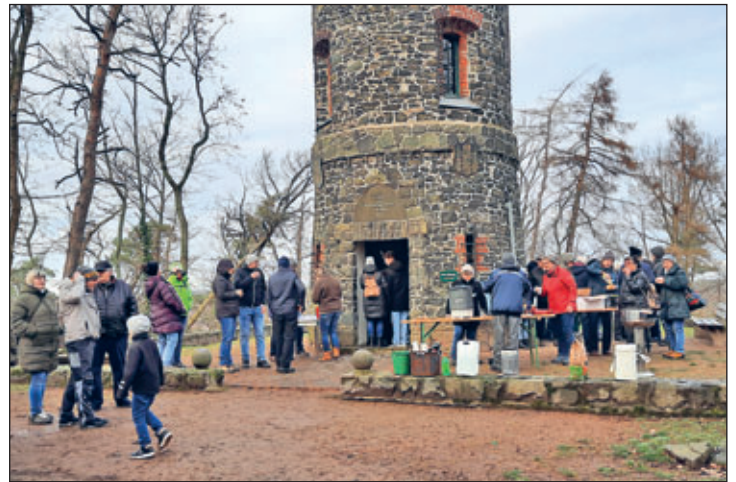
Besucher am Wachbergturm