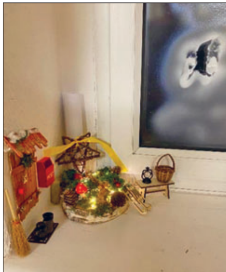
Frodo kam nachts einfach durchs Fenster geflogen und bezog auf dem Fensterbrett eine Nische in der Wand.

Auch 2023 beteiligten wir uns am Waldheimer Adventkalender. Die Kinder und Erzieherinnen des Frechdachvereins gestalteten dabei das 14. Türchen im Schaufenster der Bahnhofstraße... Ein Dankeschön an Frau Rathmann-Richter, die uns dieses zur Verfügung stellte und den Ladenraum für die Kinder festlich hergerichtete. Unter dem Motto „He-ho Grüffelo“ war die Geschichte des Grüffelos (nach dem beliebten Kinderbuch) in einer Fotostory dargestellt. Am Tag der Eröffnung hatten sich