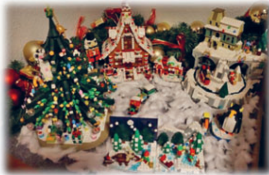
eine Lego - Ausstellung und eine Eisenbahn - Ausstellung