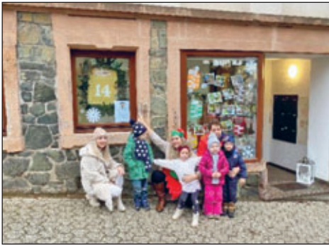
Die Kinder vom Frechdachverein präsentieren ihre Grüffelo-Ausstellung.