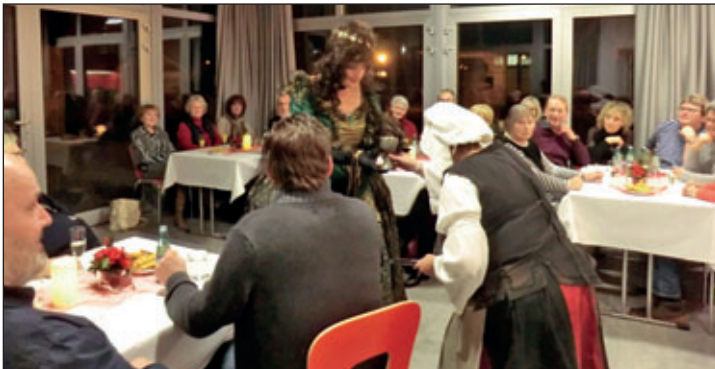
Willkommenstrunk für Gräfin Cosel

Die Reihe „Geschichte(n) im Museumshaus“ wird am 28. Februar mit einem kurzweiligen Abend rund ums Bier fortgesetzt, natürlich inklusive Verkostung einer Spezialität aus der Richzenhainer Brauerei. Eintrittskarten zu 15,00 € p.P. (erm. 12,00 €) für beide Veranstaltungen sind über das Stadt- & Museumshaus (Dienstag-Sonntag 10:00-17:00 Uhr) erhältlich.