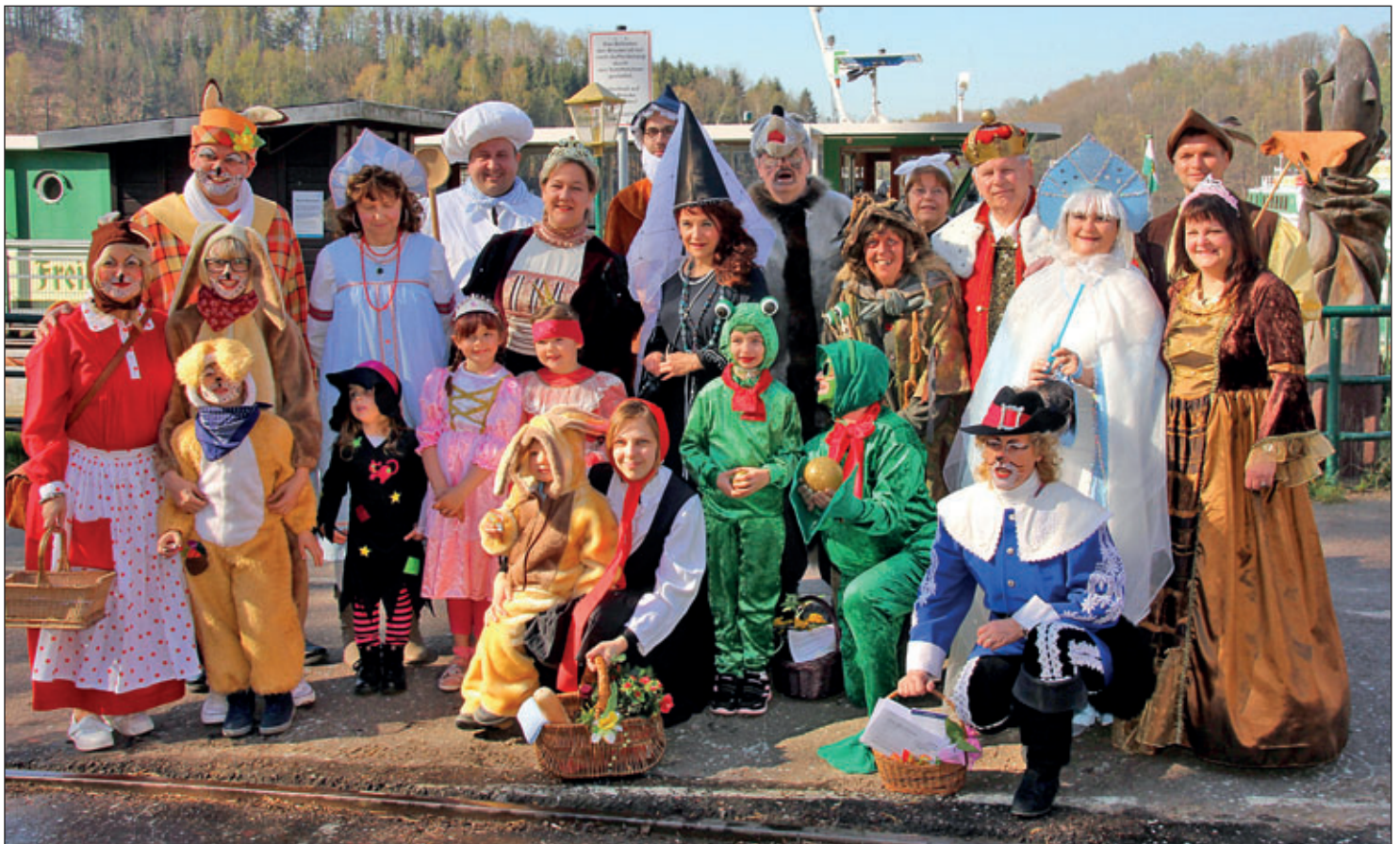
Das Team des Mittelsächsischen Kultursommers freut sich auf ein Wiedersehen im nächsten Jahr!