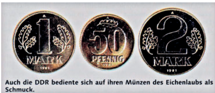
Auch die DDR bediente sich auf ihren Münzen des Eichenlaubs als Schmuck.

Ich erinnere nur an die jüngste Vergangenheit. Eichenblätter zierten die Kleinmünzen der damaligen BRD.