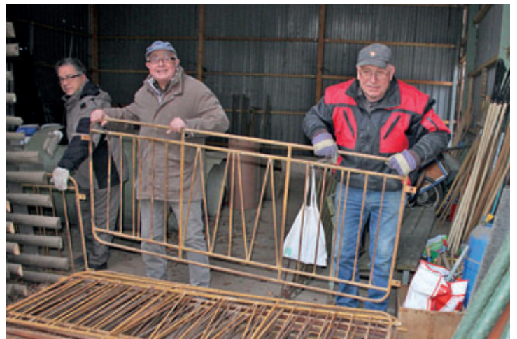
Umzug ins neue Depot