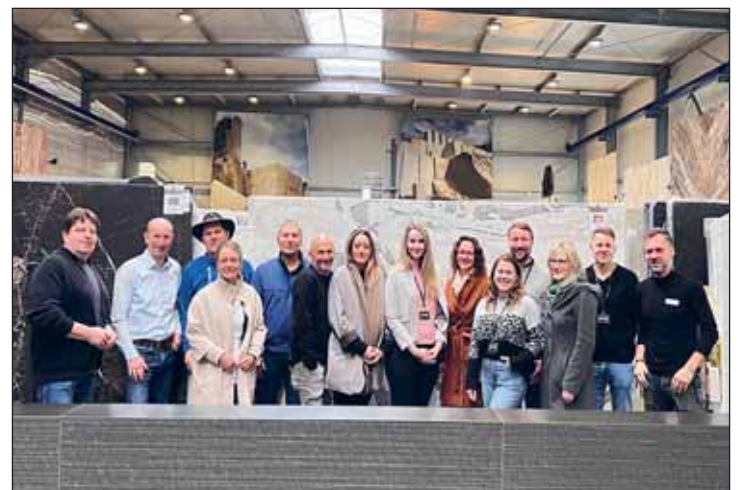
Teilnehmerkreis des ersten Unternehmengesprächs bei der JUST Naturstein GmbH in Hartha