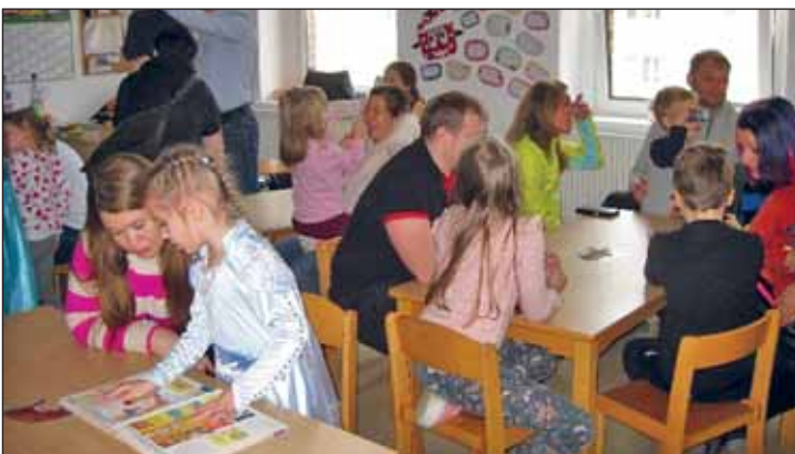
Die Kinder nutzen den Nachmittag auch, um ihren Eltern das Lieblingsspielzeug im Kindergarten zu zeigen, die Eltern freuten sich über gemeinsame Zeit mit ihrem Kind und den Austausch mit anderen Eltern.