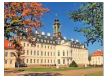
Foto: Die Ostseite von Hubertusburg im Herbst

Die Waldheimer Fotofreunde zeigen im Schaufenster der Bahnhofstraße 27 Aufnahmen von diesem schönen Barockschloss in Wermisdorf. Es wurde vor ca. 300 Jahren errichtet und nach dem Jagd-Gott Hubertus benannt. Bauherr des geschichtsträchtigen Lustschlosses war der König August dem Starke. Im Siebenjährigen Krieg erfolgte die Plünderung des Bauwerkes. Lediglich die Katholische Kirche blieb verschont.