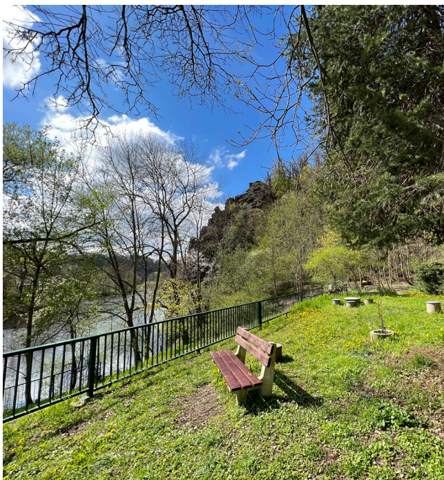
Zschopauterrasse am Kreuzfelsenplatz

Rathaus – Zschopaubrücke – nach rechts Straße An der Zschopau – einbiegen zum Spielplatz – unter der Niederstadtbrücke hindurch – Wanderweg Kirschallee mit Blick auf Kreuzfelsen und Wehr – vor dem Diedenhainer Viadukt rechts auf die Kurt-Schwabe-Straße – nach den zwei Meinsberger Brücken rechts – auf dem Wiesenweg am Mühlgraben entlang – bergauf zum Spitzberg und Kreuzfelsen (mit herrlichem Blick über Waldheim) – die Straße am Ortseingang Meinsberg überqueren – der Ausschilderung folgend – Alberthöhe mit Gedenkstätte – Wolfskehle vorbei an der Quelle bergab – rechts auf die Kornhausstraße – die Döbelner Straße überqueren – nach rechts einige Meter auf dem Fußweg bergauf der Beschilderung folgend – über den Pantoffelweg zur Zschopauterrasse , wo kleine Sitzgruppen zum Verweilen einladen – auf dem Fußweg über den Kreuzfelsenplatz bis zur Döbelner Straße – die Kreuzung geradeaus passieren – in der Niederstadt die Heiste (erhöhter Fußweg) benutzen – auf den Niedermarkt einbiegen