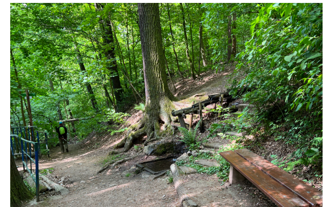
Wolfskehle mit Quelle