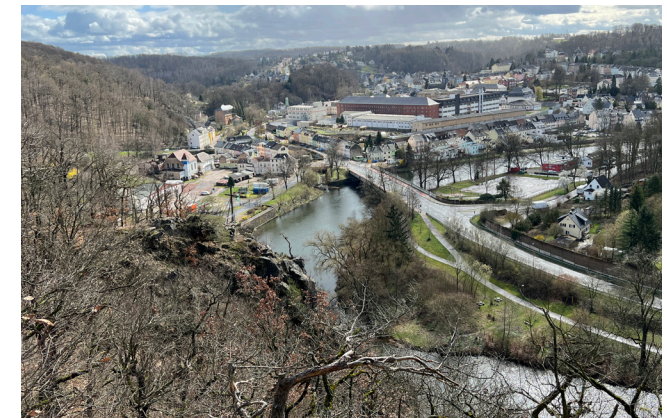
Blick vom Spitzberg auf Waldheim