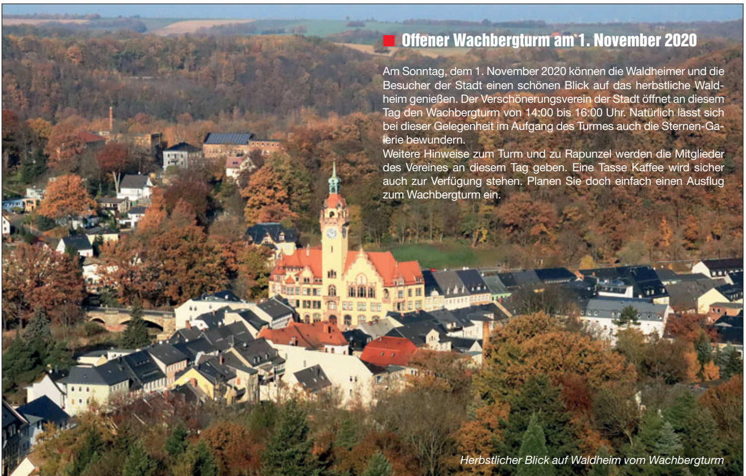
Herbstlicher Blick auf Waldheim vom Wachbergturm

Weitere Hinweise zum Turm und zu Rapunzel werden die Mitglieder des Vereines an diesem Tag geben. Eine Tasse Kaffee wird sicher auch zur Verfügung stehen. Planen Sie doch einfach einen Ausflug zum Wachbergturm ein.