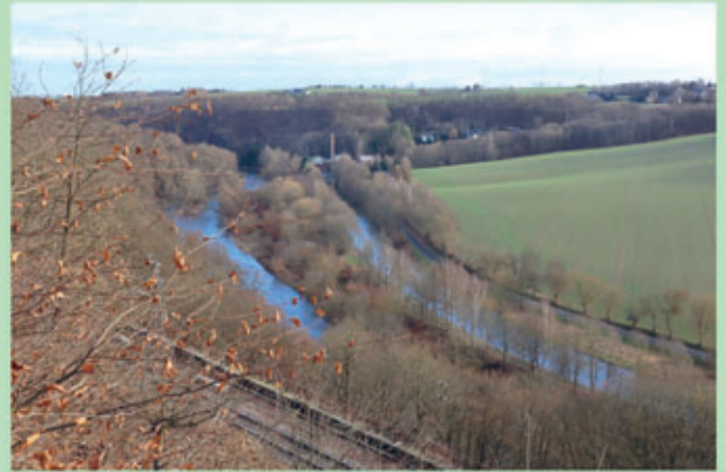
Blick vom Stufenberg

Start: 24.3.2024 10 Uhr am Waldheimer Rathaus