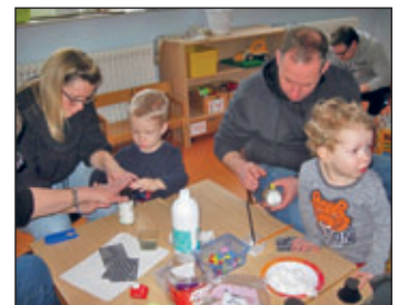
Mamas und Papas basteln fleißig an den Schneemanngläsern mit