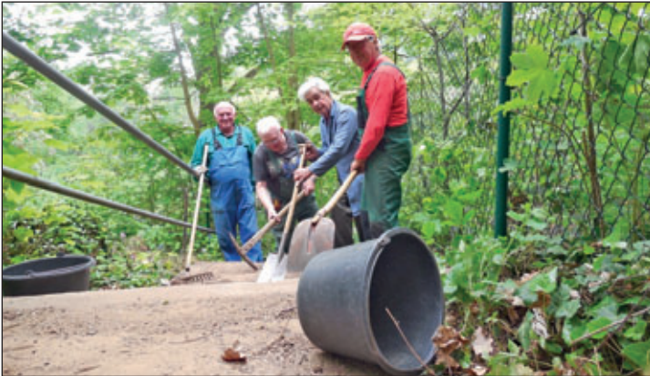
Mit vereinten Kräften werden die Stufen gerichtet.

Am 20. Mai führten einige Mitglieder und Sympathisanten des Waldheimer Verschönerungsvereins im unteren Bereich des Wanderweges von der Kriebsteiner Straße zur „Goldenen Höhe“ Instandsetzungsarbeiten durch. Zur Beseitigung einer Unfallgefahr mussten Stufen gerichtet werden, die durch mehr als armstarke Baumwurzeln regelrecht ausgehebelt und verschoben wurden. Gleichzeitig wurden noch überstehendes Gestrüch beseitigt und die Unebenheiten an den übrigen Stufen ausgeglichen. Damit ist dieser beliebte Ausgang mit dem herrlichen Ausblick von der oberen Kanzel auf die Zschopau und das Heiligenborner Tal mit seinem imposanten Eisenbahnviadukt wieder gut begehbar.