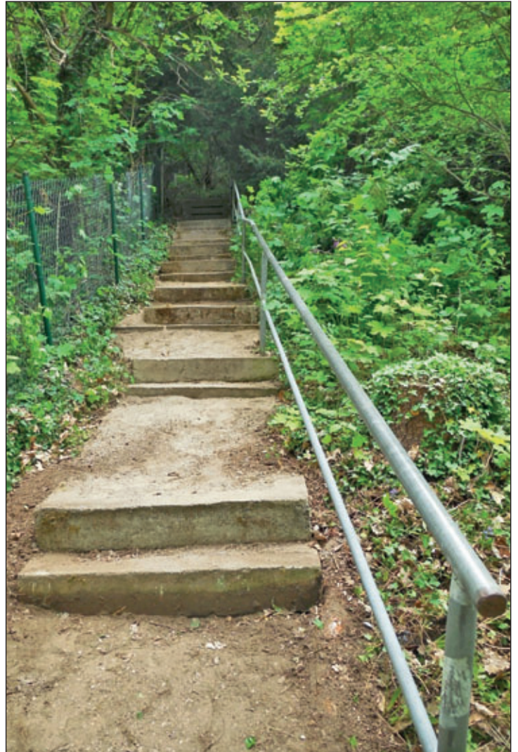
Nun ist der beliebte Wanderweg wieder ganz bequem zu begehen.

Ein herzlicher Dank gilt den fleißigen Rentnern für ihren Einsatz. Ein Dankeschön gilt auch dem freundlichen Nachbarn, dem unsere Arbeit so gefallen hatte, dass er uns spontan noch auf einen Kaffee einlud.