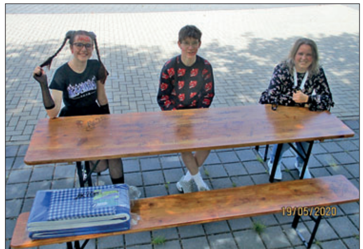
Klassensprecher und Elternsprecher