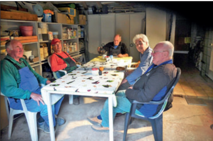
Nach der getanen Arbeit schmeckt ein Käßchen besonders gut

Am 20. Mai führten einige Mitglieder und Sympathisanten des Waldheimer Verschönerungsvereins im unteren Bereich des Wanderweges von der Kriebsteiner Straße zur „Goldenen Höhe“ Instandsetzungsarbeiten durch. Zur Beseitigung einer Unfallgefahr mussten Stufen gerichtet werden, die durch mehr als armstarke Baumwurzeln regelrecht ausgehebelt und verschoben wurden. Gleichzeitig wurden noch überstehendes Gestrüch beseitigt und die Unebenheiten an den übrigen Stufen ausgeglichen. Damit ist dieser beliebte Ausgang mit dem herrlichen Ausblick von der oberen Kanzel auf die Zschopau und das Heiligenborner Tal mit seinem imposanten Eisenbahnviadukt wieder gut begehbar.