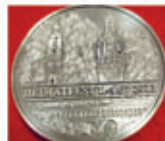
Münze 10,00 €