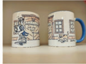
Tasse 10,00 €