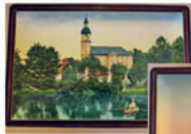
Blechschild je 12,98 €

Wie wäre es mit einem Souvenir von Waldheim?