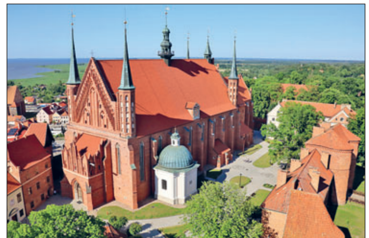
Foto: Frauenburg - Dom mit dem Frischen Haff im Hintergrund