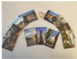
Magnete je 2,00 €