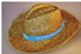
Hut 5,50 €