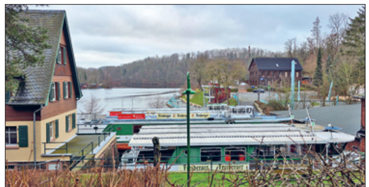
Die Fahrgastschiffe halten hier noch Winterschlaf am Hafen

Zur Stärkung öffnet die Gaststätte „An der Wendeschleife“ die Türen für unser Mittagessen. Der Rückweg wird die Gelegenheit bieten, den neuen Burgberg hinunter zu laufen und über den Rausenthaler Weg nach Waldheim zu gelangen. Gegen 14.30 Uhr könnte nach den ca. 13,5 km das Rathaus wieder erreicht sein.