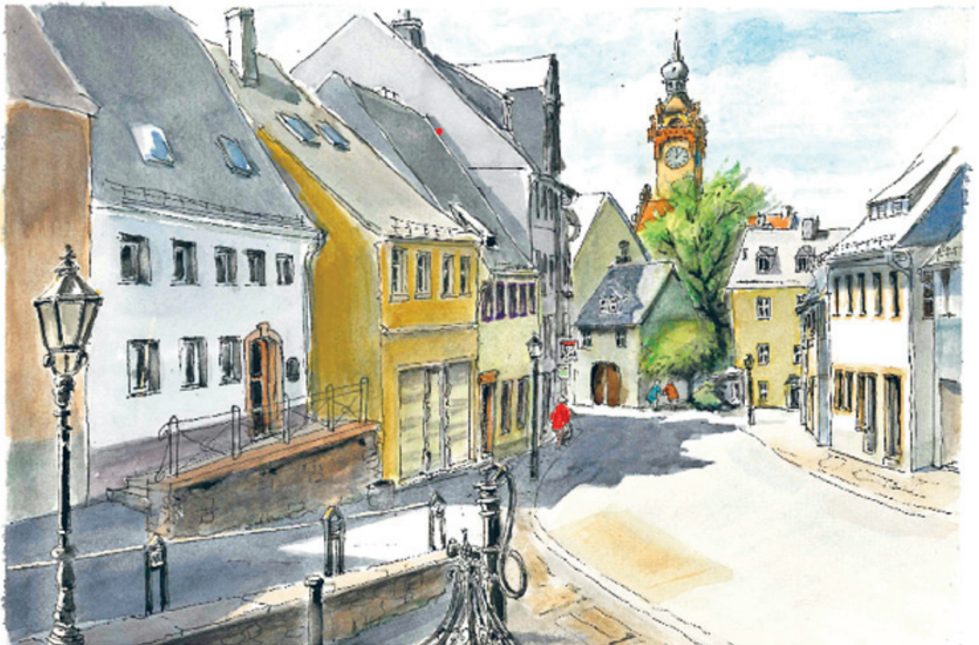
Die Schlosstraße in Waldheim