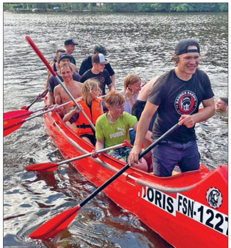
so haben wir bei den heißen Temperaturen bei zu staubiger Strecke in Reinsdorf trainiert um Teamgeist und Zusammenhalt zu stärken.