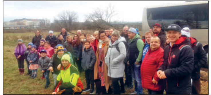
Vereinsausfahrt vom 29.12.22 mit Freunden per Reisebus 48 Persen als entspannter Ausflug ins Weihnachtstheater nach Dresden