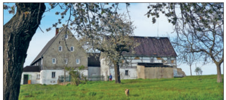
Südansicht Dreiseithof in Massanei