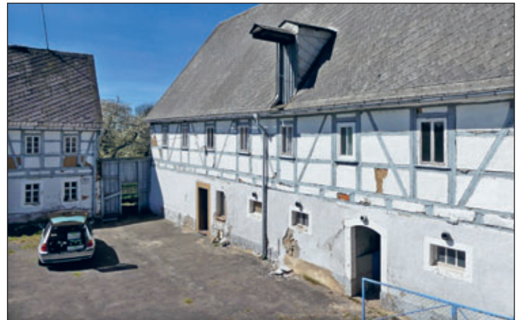
Hofansicht mit Teilen des Auszugshauses sowie dem Wohnstallhaus (re)

Bauberatungsstelle Helbigsdorf, Kay Arnswald, Telefon: 0172 79 365 90 E-Mail: KayArnswald@gmx.de