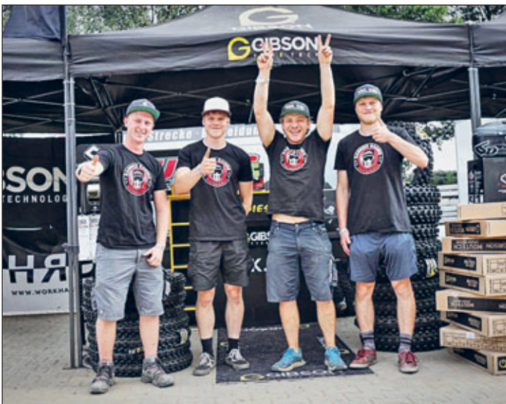
Bauschheim Serviceteam ( größtes Amateur MX Event in Deutschland mit Fahrern und Helfern Raudies Racing