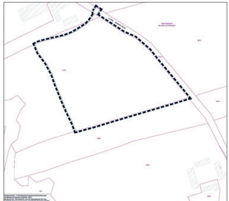
Abb. 1: Übersichtsplan Geltungsbereich zum Bebauungsplan Nr. 17 Bereich Rudelsdorf „Solarpark Rudelsdorf“