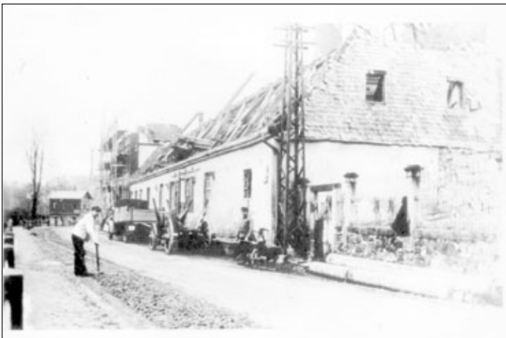
Aufnahme vom 24.01.1939

Mit Inbetriebnahme der neuen Betriebsstätte im Jahr 1938 wurden die alten Molkereigebäude in der Kriebsteiner Straße abgerissen.