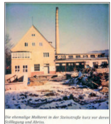
Die ehemalige Molkerei in der Steinstraße kurz vor deren Stilllegung und Abriss.

Ende 1990 wurde mit der Demontage von Maschinen und Bauteilen begonnen die in den Molkereien Torgau, Oschatz, Dahlen und Mügeln einen neuen Standort fanden. 1993 wurde das gesamte Objekt entkernt und abgerissen. Auf dem einstigen Gelände errichtete ein Privatinvestor Wohnungen, Läden und einen Einkaufsmarkt. Von der Molkerei sieht man heute gar nichts mehr. Damit ging der Stadt Waldheim wieder ein Stück Identität verloren.