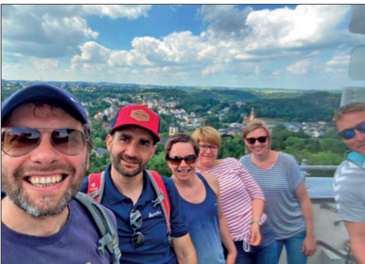
Auf dem Wachbergturm: Die sechs Wanderer genießen den wunderbaren Rundum-Blick auf die Stadt Waldheim