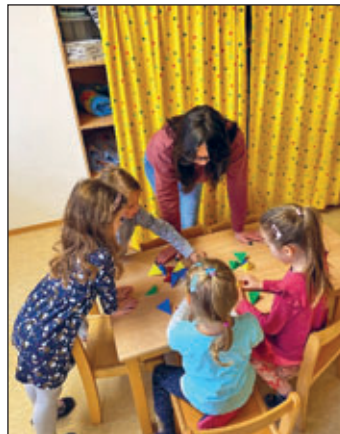
Die Mädchen puzzeln magnetische Pyramiden zu einem Würfel zusammen.