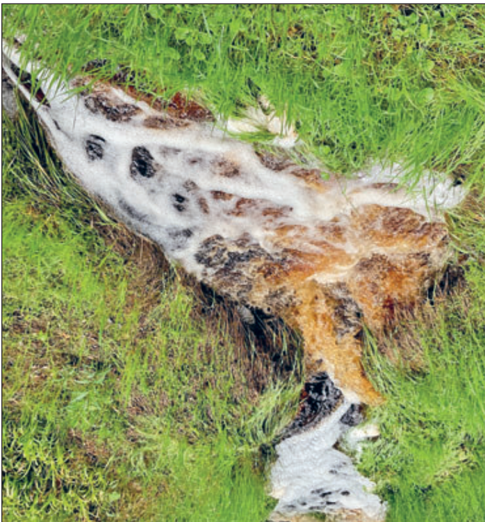
Eine natürliche Schaumbildung kommt beispielsweise bei Bächen aus Moorgebieten wie hier im Erzgebirge vor und ist nicht bedenklich.

Dieser Text entstand in Zusammenarbeit der Fachberaterinnen und Fachberater Gewässer des Landesamtes für Umwelt, Landwirtschaft und Geologie und der unteren Wasserbehörde des Landkreises.