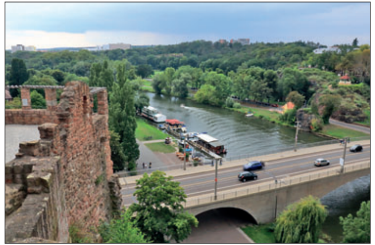
Blick von der Burg Giebichenstein auf die Saale in Halle