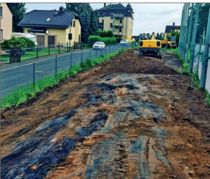
Bauabschnitt Hangbegradigung Großer Dank an die Firma P&W Bau GmbH - Baumaschinenhandel und Vermietung für die Unterstützung und Umsetzung.