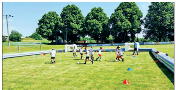
Im Juni war das Tretschok Fussballzentrum e.V. bei uns in Richzenhain zu Gast. Mit Unterstützung der Sparkasse Döbeln und Beteiligung des Landessportbund Sachsen erlebten die Kinder zwei tolle Tage. Mit viel Spaß und Freude lernten sie neue Übungen und Spiele kennen, aber auch Themen wie Team-Building und Fairplay kamen nicht zu kurz. Vielen Dank an alle Organisatoren.