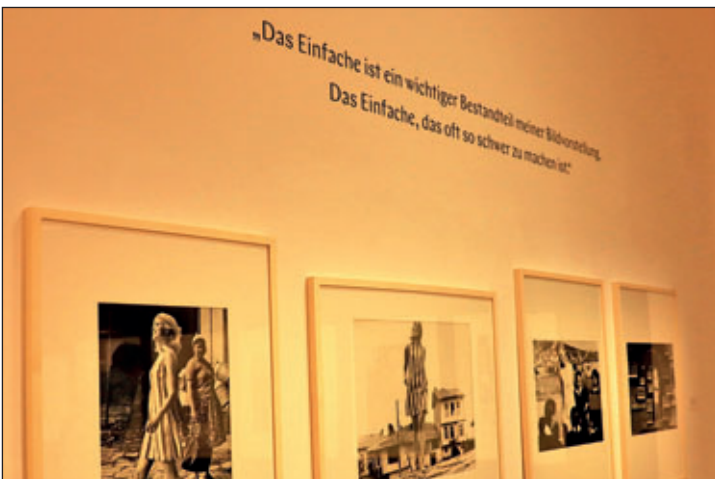
Ausstellung Günther Rössler in Halle – „Das Einfache ist ein wichtiger Bestandteil meiner Bildbetrachtung“