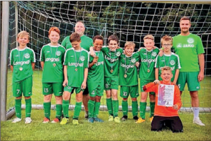
Im Juli erreichte unsere "neue" D-Jugend bei den Nachwuchstagen des SV Medizin Hochweitzschen e.V. einen starken 3. Platz.