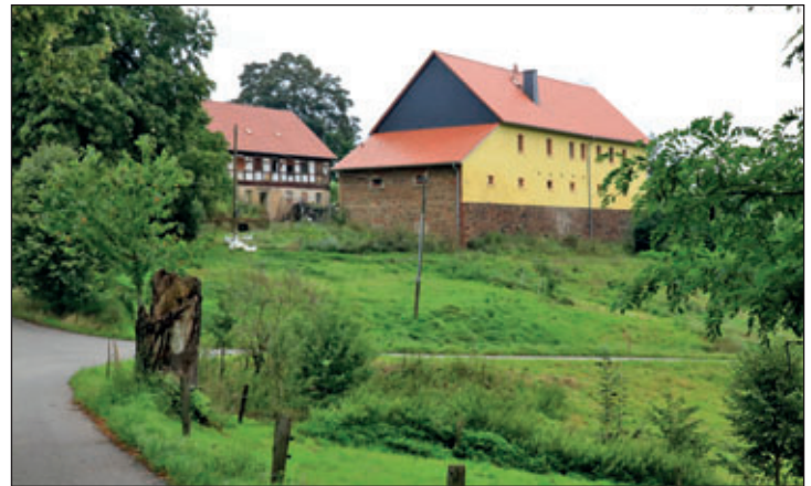
An diesem Grundstück in Gilsberg wird die Wanderung vorbei gehen

Wenn es die aktuelle Situation erlaubt, wird der Waldheimer Verschönerungsverein am Sonntag, dem 10. Oktober 2021, wieder eine Herbstwanderung durchführen. Diese wird 10 Uhr am Rathaus beginnen. Sie führt über das Sauergras, Gilsberg und Reinsdorf zum Schweikershainer Bach. Im unteren Verlauf standen früher zwei Mühlen. Die Wanderer werden zu den ehemaligen Bauwerken Informationen von den Heimatfreunden erhalten. Das Mittagessen ist in Kriebethal geplant. Nach jetzigem Stand wird der Rückweg über Neuschönberg erfolgen. Witterungsbedingte Kleidung und festes Schuhwerk sind erforderlich. Die Teilnahme erfolgt in eigener Verantwortung.