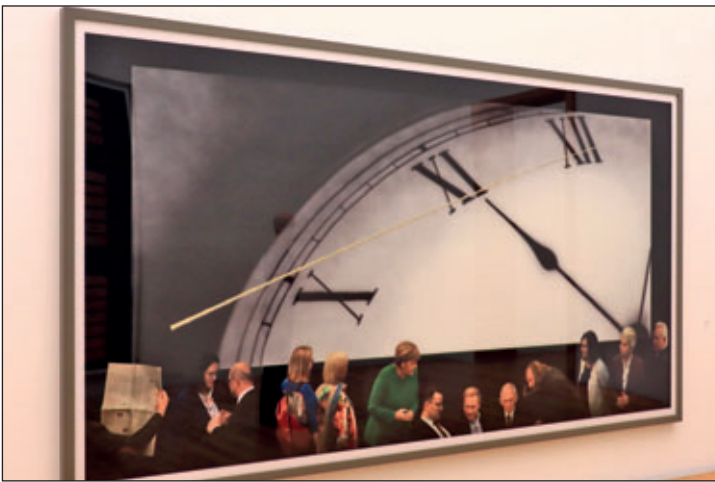
Ausstellung Prof. Andreas Gursky in Leipzig – 5 vor 12 Konstruktion

Die Fotofreunde konnten sich Anregungen für die eigene Arbeit holen. Die Mitglieder der IG treffen sich aller 14 Tage. Wer Lust zum Erfahrungsaustausch hat, bitte einfach über Tel. 0170 1816 319 melden.