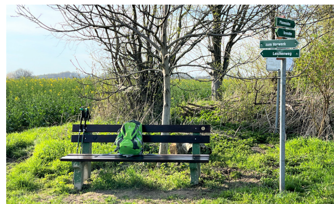
Wanderweg-Kreuzung oberhalb Kriebethal