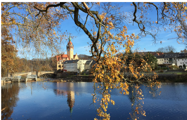
Blick auf das Rathaus vom Brückenmühlenpark

Die Benutzung des Rundwanderweges erfolgt auf eigene Gefahr. Das Höhenprofil entnehmen Sie bitte der Karte. Der Wanderweg hat teilweise einen mittleren Schwierigkeitsgrad. Bitte halten Sie die Natur sauber und beschädigen Sie unsere Sitzgruppen und Beschilderung nicht.