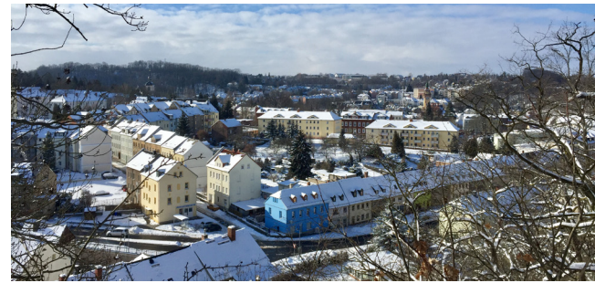
Blick auf die Oststadt vom Majoranberg