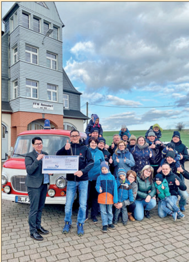
Der Feuerwehrverein Reinsdorf e.V. freut sich über 1000 Euro von der VR-Bank Mittelsachsen. Die Summe stammt von dem Verkaufserlös der Kalender der Volksbank Mittelsachsen.

Das Geld soll für die Kinder- und Jugendarbeit verwendet werden und für die Anschaffung von Poloshirts für die Frauen vom Feuerwehrverein Reinsdorf e.V.