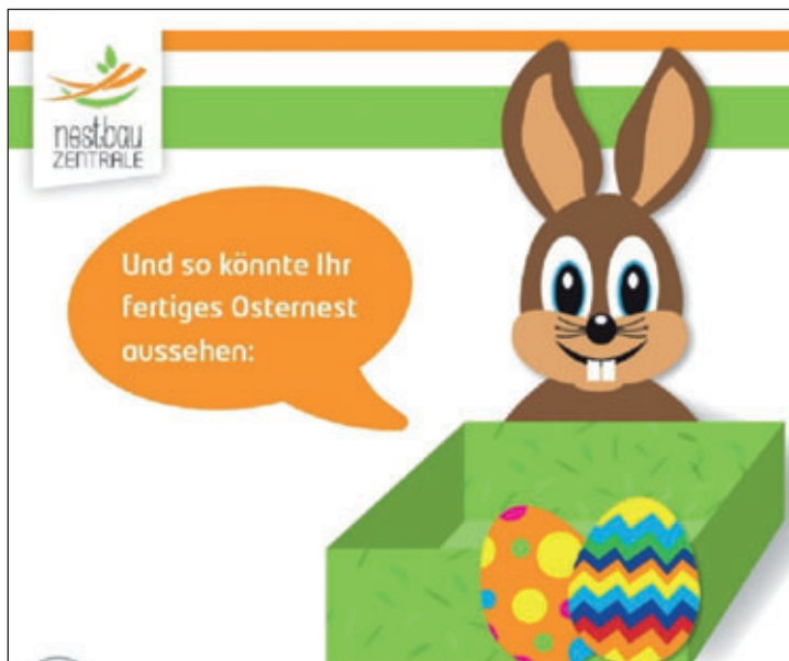
Text/Bastelvorlage: Nestbau-Zentrale Mittelsachsen

Alle Materialien werden demnächst auf unserer Internetseite zum Download bereitgestellt ( www.nestbau-mittelsachsen.de/downloads ). Auch ein Gewinnspiel ist in der Vorbereitung, welches zu gegebener Zeit ebenfalls noch veröffentlicht wird. Für Rückfragen steht die Nestbau-Zentrale gern zur Verfügung. Wir wünschen allen Kindern, Familien und Mitarbeitern der Kindereinrichtungen einen tollen Frühling, Vorfreude auf eine bunte Osterzeit und einen fleißigen Meister Lampe!