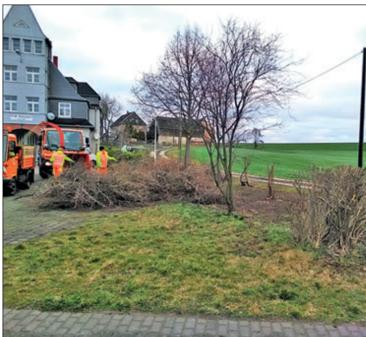
Der Bauhof führte Pflegearbeiten an Bäumen im Stadtgebiet durch.