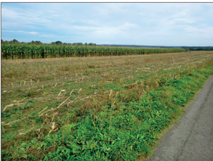
Maisfeld zur Ernte September 2017

Genau hier liegt der Teufel im Detail. Futter zukaufen – woher? Die Füttersituation im Umkreis sieht rund herum gleich schlecht aus. Preisanstiege für Heu liegen seit Juni bei bis zu 20 %. Jetzt schon das vorrätige Winterfutter aufbrauchen – was wird dann im Winter? Andere Winterfutterquellen, wie z.B. Mais oder auch Futterkartoffeln werden in diesem Jahr eher begrenzt zur Verfügung stehen und diese alleinige Fütterung ist nicht tierartgerecht. Wiederkäuer brauchen Grobfuttermittel, wie Silage, Heu oder Stroh.