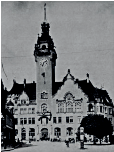
Die Fotografie zeigt die sowjetische Kommandantur im Rathaus Waldheim. Unterhalb der Turmuhr hängt ein Roter Stern, der noch heute erhalten ist und sich im Museumsfundus befindet.

Im gleichen Jahr begann er als freischaffender Kunstmaler zu arbeiten.