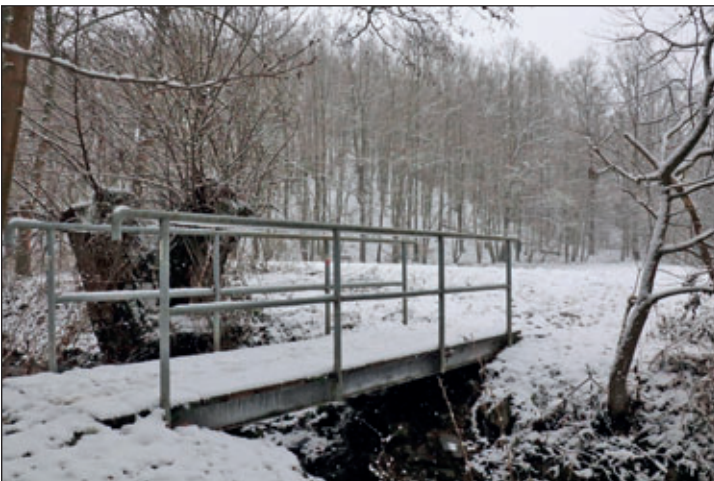
Das Sauergras wird von den Waldheimern gern für Wanderungen genutzt – hier die Brücke über den Richzenhainer Bach. Natürlich sollte man immer die aktuellen Wetterverhältnisse beachten.

Auf Wanderungen muss keiner verzichten. Jeder kann für sich viele gut ausgeschilderte Wanderwege in der Umgebung der Stadt nutzen. Für die unterschiedlichsten Ansprüche gibt es Möglichkeiten. Die Informationstafeln im Waldheimer Stadtgebiet geben darüber Auskunft. An der Tafel auf dem Niedermarkt findet man eine Box, in der Flyer zu den Wanderwegen enthalten sind.