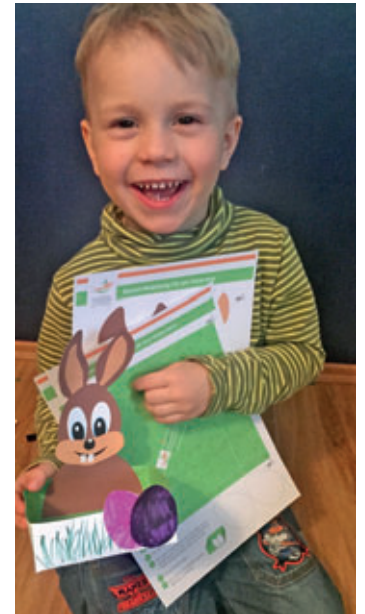
Hugo macht es vor und bastelt ein Osternest für Nestbau in Mittelsachsen.

Nestbau-Zentrale Mittelsachsen Rosa-Luxemburg-Straße 1, 04720 Döbeln Telefon: 03431/7057158 Email: info@nestbau-mittelsachsen.de Internet: www.nestbau-mittelsachsen.de